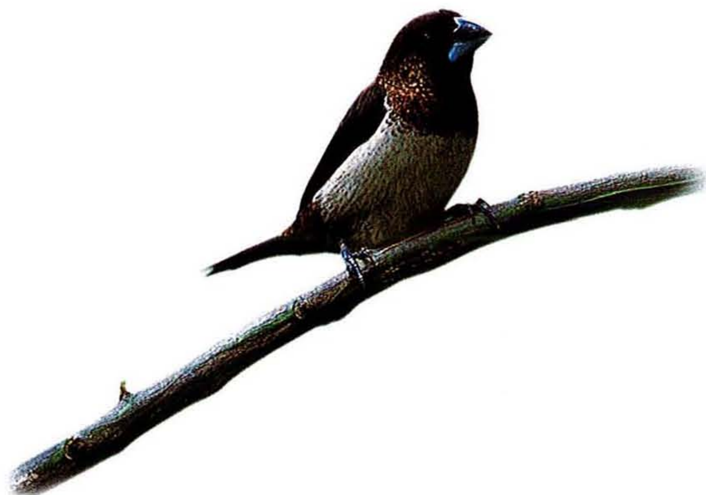
นกกระตีดตะโพกขาว / White-rumped Munia ขนาด 11 ซม.

เหตุการณ์นี้จะเกิดในอีก ๒,๐๐๐ ปีข้างหน้า